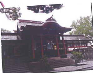
隼人馬場から車で3分 徒歩10分

木造建築では日本最大級の広さをモト 本殿があります。 天津日高彦彦尊(山幸彦)と、 その姫の豊玉姫を御祭神としていま す。静かな境内にいらると心が洗われます。