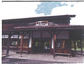
おおすみよなかの 大隅横川