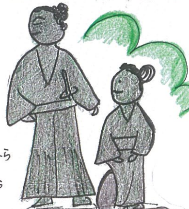
坂本龍馬・お龍新婚湯治馬場